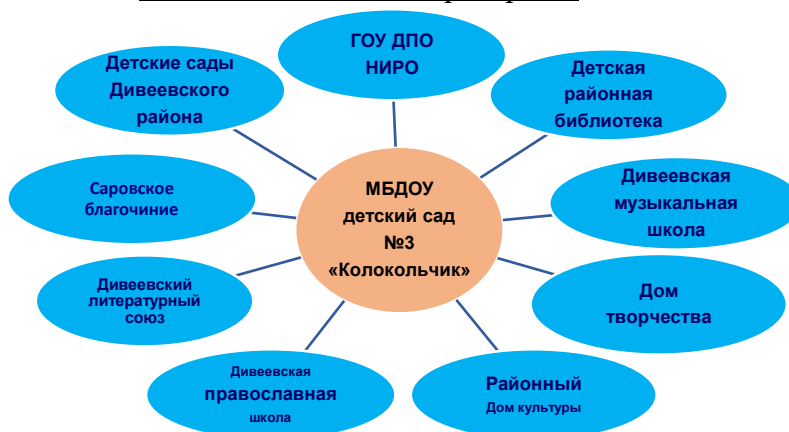
Схема социального партнерства.

На протяжении ряда лет у учреждения сложились тесные партнерские отношения со многими учреждениями и социальными объектами села. На начало каждого учебного года составляются совместные планы работ с учреждениями – партнерами, которые двухсторонне утверждаются: заведующим ДОО и руководителем учреждения- партнера. В плане учитывается направленность деятельности ДОО и возрастные особенности воспитанников.