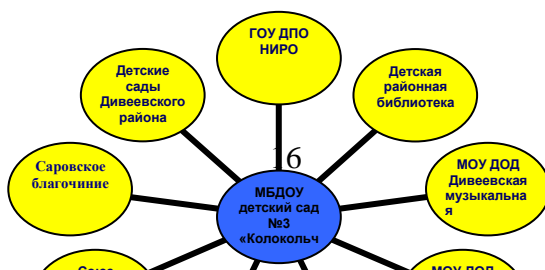
Схема социального партнерства.

На протяжении ряда лет у учреждения сложились тесные партнерские отношения со многими учреждениями и социальными объектами села. На начало каждого учебного года составляются совместные планы работ с учреждениями – партнерами, которые двухсторонне утверждаются: заведующим ДОО и руководителем учреждения- партнера. В плане учитывается направленность деятельности ДОО и возрастные особенности воспитанников.