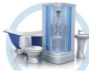
ТУАЛЕТ (УНИТАЗ, ВАННА, ДУШЕВАЯ КАБИНА, БИДЕ)