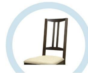
СПИНКИ СТУЛЬЕВ, НЕ ОБИТЫЕ ТКАНЬЮ И МЯГКИМ ПОРИСТЫМ МАТЕРИАЛОМ