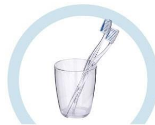
ТУАЛЕТНЫЕ ПРИНАДЛЕЖНОСТИ (ЗУБНЫЕ ЩЕТКИ, РАСЧЕСКИ И ПР.)