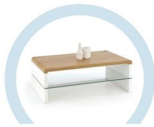
ЖУРНАЛЬНЫЕ СТОЛИКИ И ПРОЧИЕ ЖЕСТКИЕ ПОВЕРХНОСТИ